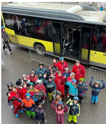
Juku Anreise mit dem Skibus