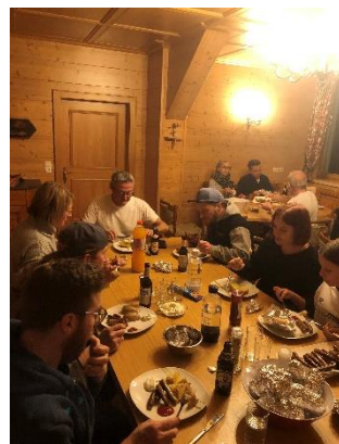
Abendessen im Vereinshaus