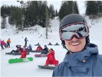
Snowboardkurs im Skicamp