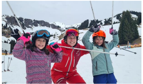
Skikurs bei der Familienfreizeit