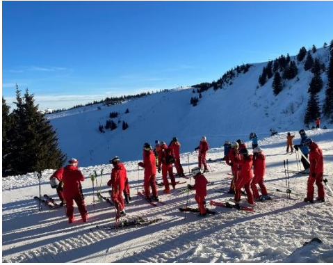
Skiteam trainiert in Bezau