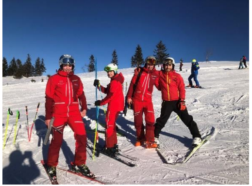
Gemeinsames Training mit Kreenheinstetten